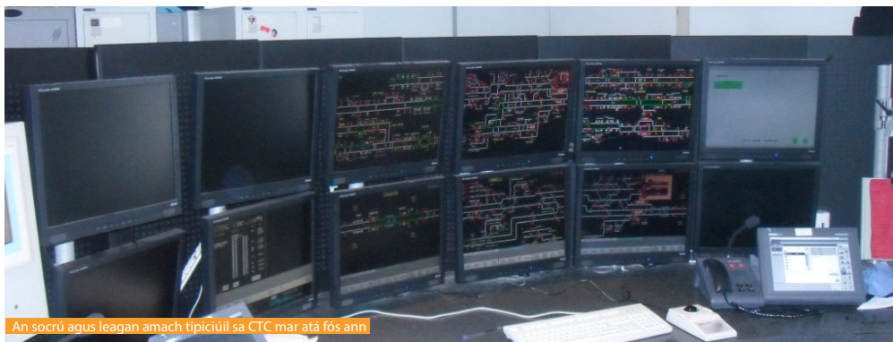
An sócrú agus leagan amach tipiciúil sa CTC mar atá fós ann

Déantar an 25% eile a rialú ó roinnt láithreáin áitiúla atá scaipthe ar fud an líonra agus ní féidir é a chomhtháthú leis an CTC atá ann cheana mar gheall ar na srianta atá ann maidir leis an acmhainneacht.