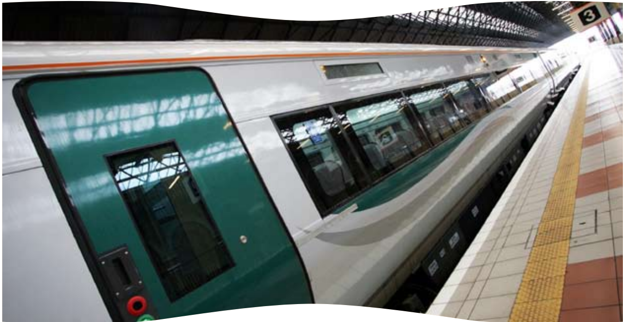
Ráilcharr Idirchathrach nua Iarnród Éireann, a tháinig isteach i seirbhís ar líne Sligeach/Baile Átha Cliath i mí na Nollag 2007.

Lean an clár infheistíochta is mó riamh i líonra agus seirbhísí Iarnród Éireann ar aghaidh ag íoc díbhinní i 2007, le curriarracht eile leagtha don líon is airde riamh de thurais phaisinéirí a taifeadh, 45.5 milliún turas. I measc gnéithe eile bhí: